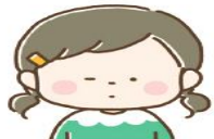
片目をつぶって見る