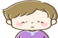
片方の目の焦点が合わない

見る力は、目から情報を取り入れ、脳で処理することを、毎日繰り返して育ちます。ところが、目に異常があると脳に情報が届かず、見る力が育ちません。早く治療を始めるほど回復しやすいため、見え方の異常に気づいたら、早めに眼科で相談しましょう。