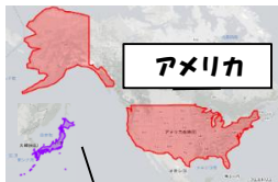
※日本の大きさ比較

ポテトウェッジ ：ウェッジとは楔(くさび、断面が三角)という意味です。じゃがいもをくし型に切り、チキンシーズニングやガーリックパウダー等で下味をつけてからりと揚げたものです。