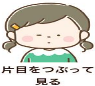
片目をつぶって見る