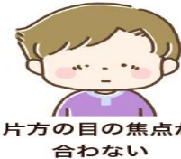
片方の目の焦点が合わない

見る力は、目から情報を取り入れ、脳で処理することを、毎日繰り返して育ちます。ところが、目に異常があると脳に情報が届かず、見る力が育ちません。早く治療を始めるほど回復しやすいので、見え方の異常に気づいたら、早めに眼科で相談しましょう。