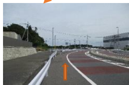
この先右カーブに見えますが十字路です。