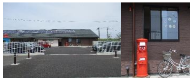
赤いポストが目印のちいさな杜の保育園。 あひるルームはこの奥の部屋です。

市役所方面から来られる方はグッドマンビジネスパークのある信号を右折してください。