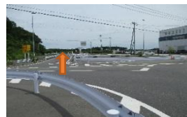
十字路に差し掛かったら左にウインカーを出し、左折後すぐに右ウインカーを出し、行き止まりの看板をそのまままっすぐ進みます。