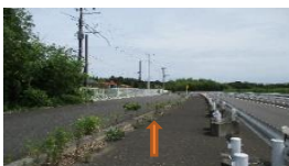
少し走ると左手に白いフェンスが見えてきます