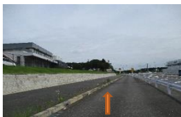
船橋印西線を北へコスモスキッチンを左手に進みます